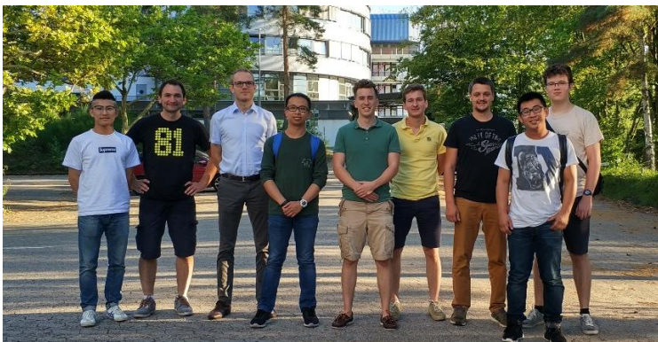
Abbildung 1 Gründungsversammlung am 16 August 2018.