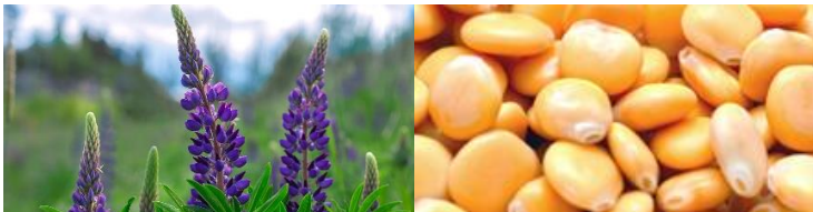
Abbildung 4 Lupinen- Pflanzen und -Saat

*Titel des Vortrages von Alexander Bauer, purvegan GmbH, am 4.12.2018, auf Einladung des Nachhaltigkeitsbüros.